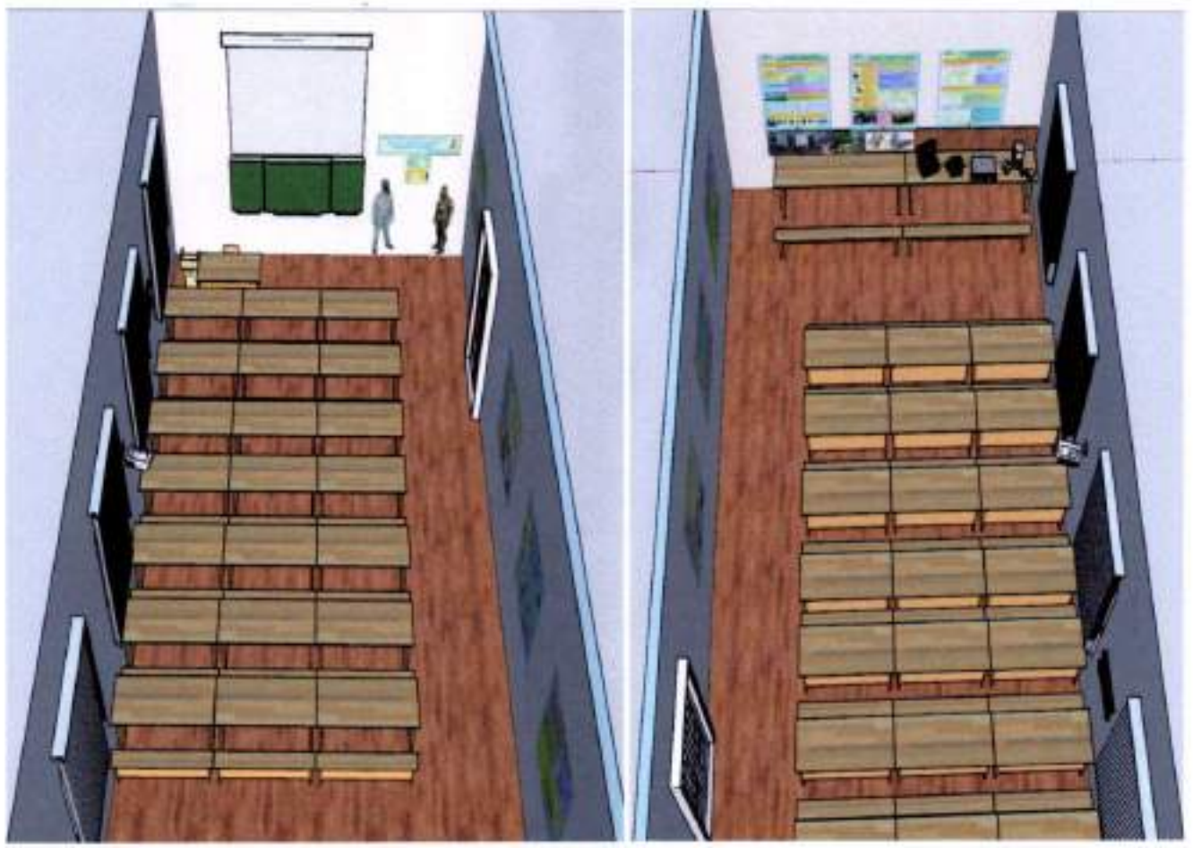
Фронтальний вид навчального класу